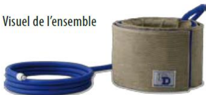
Visuel de l'ensemble