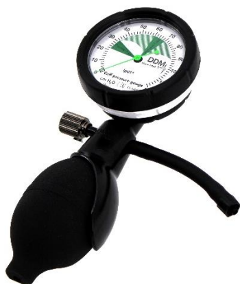
Visuel de face